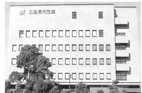
三重信用金庫本店 (松阪市)