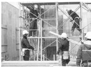
労働環境の改善が急務

建設業界で週休2日導入の取り組みが広がっています。大和ハウス工業は4月から全国の工事現場で日曜日以外に月1回、土曜日に休めるようにして、2021年4月をめどに原則、週休2日とします。竹中工務店は21年度末までの週休2日実現を目指しています。戸建て住宅やオフィスビルなどの建設現場では仕事を止めるのは日曜日だけが一般的で、建設業は全産業平均に比べて年間労働時間が約2割長くなっています。人手不足が深刻化する中、労働環境を改善し、若手の建設技能者の確保に繋げるのが目的。大和ハウスは4月から新規に着工する現場に完全な「休工日」を導入します。原則、土・日曜日以外の休みを月2回に増やし、21年4月は完全週休2日とする方針。プレハブ各社も随する見通し。