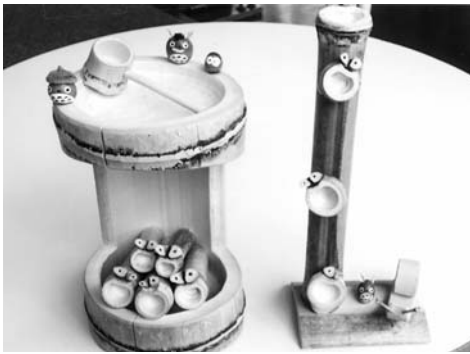
竹細工 山崎一雄さん作 (津市白山町)

本部 四日市市芝田1丁目11-27 ☎(059)356-1017 中勢支部 松阪支部 津市上井財町18-13ワーブビル2F ☎(059)213-1193 伊賀支部 伊賀市上林670 ☎(059)213-1193 名張支部 名張市緑が丘東182 ☎(059)213-1193 南勢支部 伊勢市本町2-4 ☎(0596)29-1717 HP://www.tokai-ippan.net/