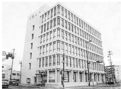
桑名信用金庫本店 (桑名市)