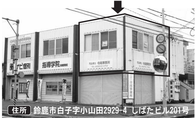
住所 鈴鹿市白子字小山田2929-4 しばたビル201号

本部 四日市市芝田1丁目11-27 ☎(059)356-1017 中勢支部 松阪支部 津市上井財町18-13ワープビル2F ☎(059)213-1193 伊賀支部 伊賀市上林670 ☎(059)213-1193 名張支部 名張市緑が丘東182 ☎(059)213-1193 南勢支部 伊勢市本町2-4 ☎(0596)29-1717 HP://www.tokai-ippan.net/