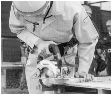
建設業界の人手不足と高齢化は危機的状況

きつい・汚い・危険の「3K」職場といわれる建設業界は大手ゼネコンや、ハウスメーカーのもとに下請けの中小企業が重なっています。新卒の3年以内の離職率は高卒が42%、大卒で30%となっています。人手不足と高齢化が深刻となり、社員に寄り添った人材育成やデジタル技術を使った作業効率の改善などで状況を打開する中小企業が増えています。建設業界は親方など独立志向が強い人が多い